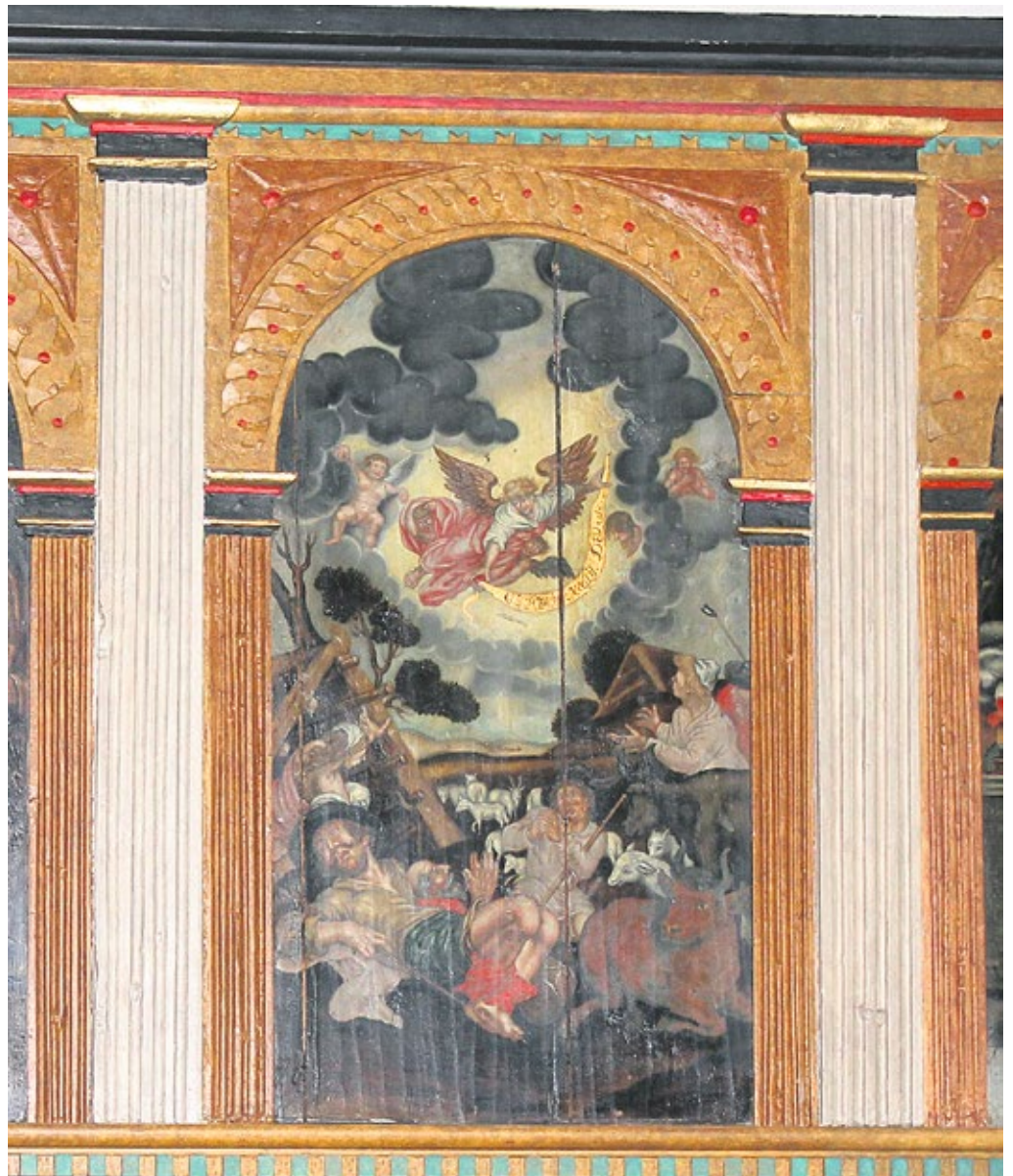
Engel mit Hirten auf der Empore in der Neuender Kirche.

Gerade in diesen Wochen vor Weihnachten, in denen viele spüren, wie eng die Zeit, wie groß die Sorgen oder wie einsam die Tage sein können, brauchen wir jemanden, der